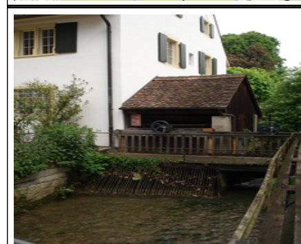
Brüglingen Hofgut und Mühle